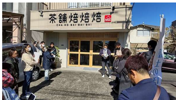
コース3: 日本茶茶茶(株)