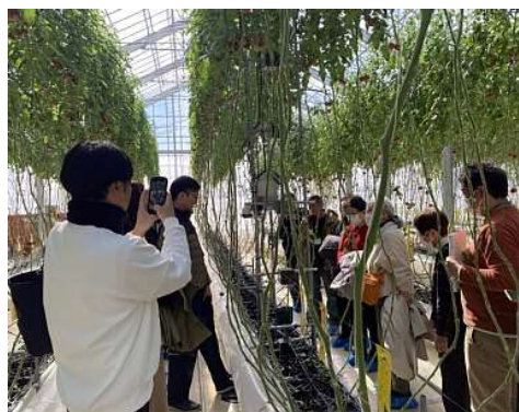
コース1: 佐藤ファーム